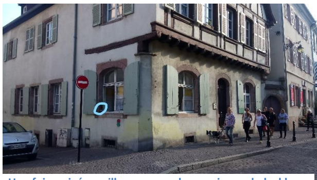
Une fois arrivé, veuillez vous rendre au niveau du lockbox pour récupérer les clés

Pour une flexibilité maximale, Travel Homes vous permet d'entrer dans l'appartement à tout moment après l'heure de check-in. Voici les différentes étapes pour y accéder.