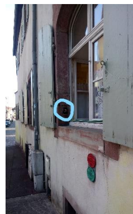
Il est fixé sur la façade, à côté de la fenêtre