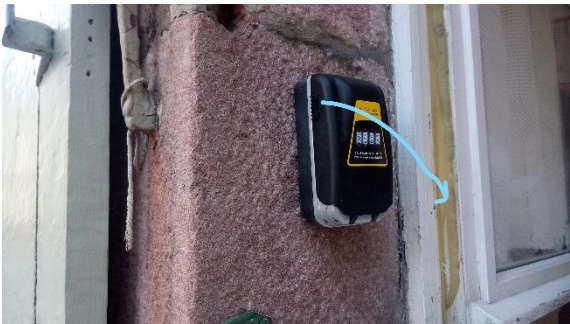
Baissez le clapet noir