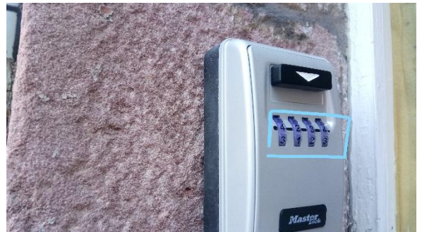
Composez le code