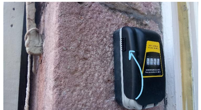
Brouillez la combinaison et refermez le clapet