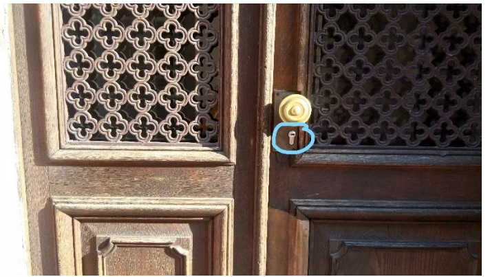
Utilisez la grosse clef noire pour ouvrir la porte d'entrée