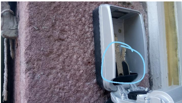
Vous pouvez ouvrir le lockbox et récupérer les clés