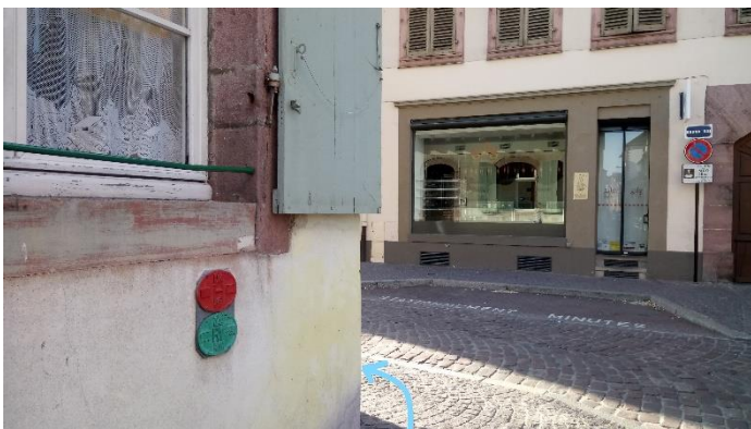
Direction la porte d'entrée !